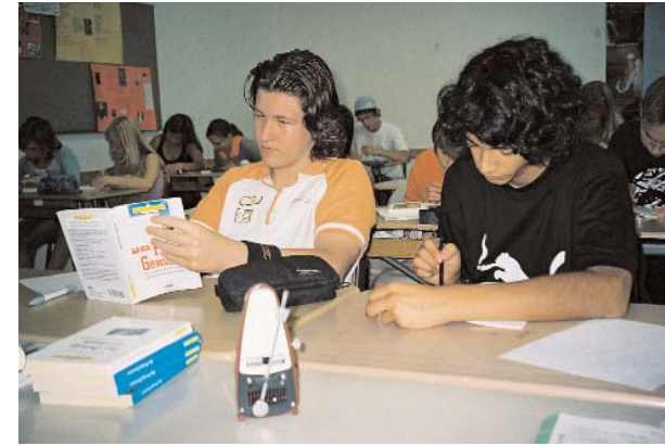
Das Taktell gibt den Rhythmus vor. So lässt sich die Lesegeschwindigkeit schrittweise steigern.

Spaß beim Lesen haben und Armen in Indien helfen...was will man mehr?